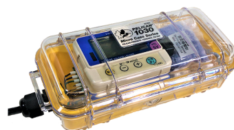
MIJ-12 waterproof (1ch)