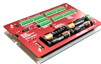
MIJ-01 Multichannel (DIFF 8ch SE 16ch)